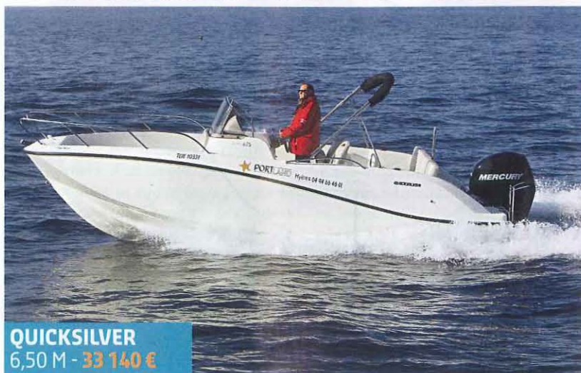
QUICKSILVER 6,50 M - 33 140 €