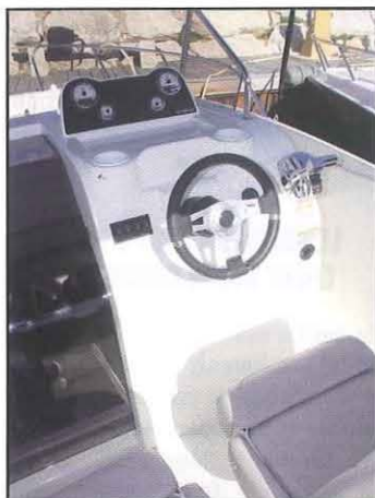
ACTIV 675 SUNDECK