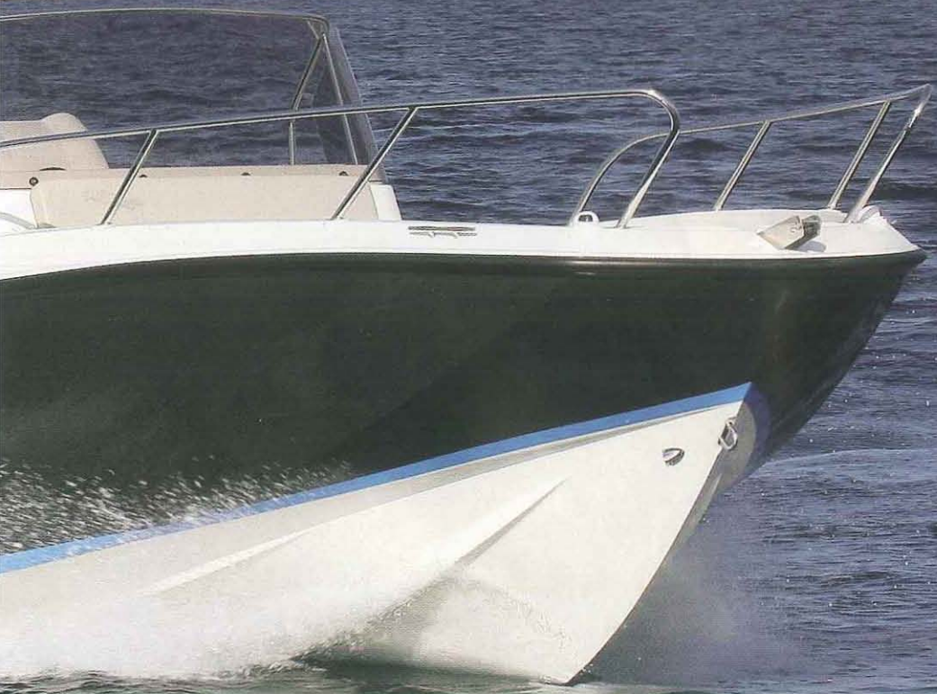
ACTIV 675 SUNDECK